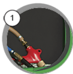
ОБЛИЦОВКА СТЕН КАБИНЫ